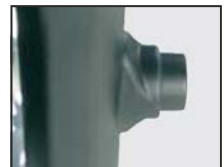
Höhenverstellung der Armlehne