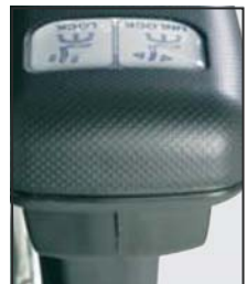
Taster zur Verstellung der Sitzhöhe u. Synchronmechanik