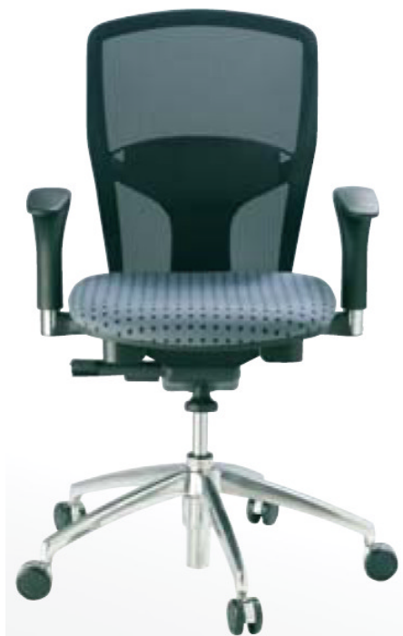
Rückenbezug im Netzdesign