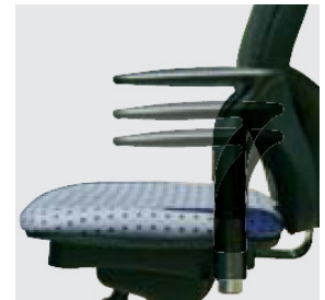
höhenverstellbare und schwenkbare Armlehnen